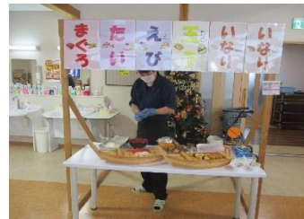
23日:クリスマスケーキ作り